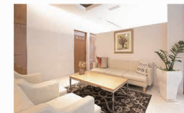
CUT·S アイラッシュ & エステティックサロン 宮通り店