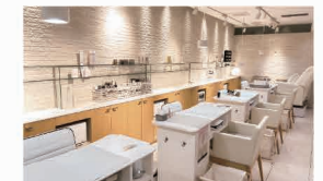
CUT·S ネイルサロン 元町店