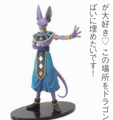
今ほしいモノは ビルス様~♪

小さい頃から見て特に魔人ブウと17号が大好き♡この場所をドラゴンボールっぽいに埋めたいです!