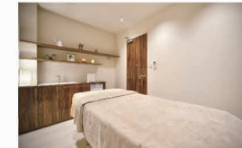
CUT·S エステティックサロン 春日店